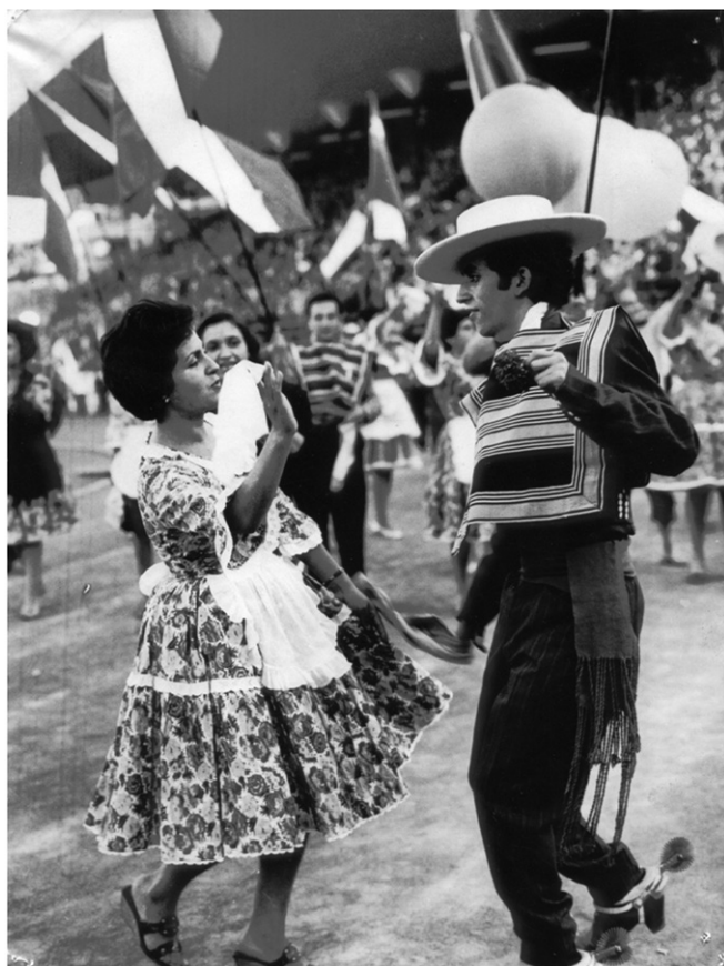
Figura 3. Ángel Parra (de huaso) y Violeta Parra (en segundo plano) en el desfile inaugural del 8° Festival Mundial de la Juventud y los Estudiantes, 29 de julio, 1962.

Violeta Parra y sus hijos participaron de los desfiles de la delegación chilena en el Estadio Olímpico, y en las actividades musicales previstas durante el festival (ver Figuras 3 y 4). Si Ángel Parra se sentía “una atracción circense” debido al traje típico que se veía obligado a vestir (Parra 2016: 79), la cantautora tuvo una participación artística más tradicional. El diario local Helsingin Sanomat [La Gaceta de Helsinki] promocionaba, por ejemplo, una “Exposición de Arte” compuesta de pinturas y arpilleras en el Club Internacional de Helsinki, y algunas presentaciones en el hall del Conservatorio de la misma ciudad (HS 1962). Tal como ocurrió en 1955, estas actividades le valieron a la cantautora una medalla de reconocimiento y una invitación a formar parte del jurado en un concurso de danzas y cantos folclóricos, “siete horas de trabajo intenso, [donde] vi ante mis ojos cien danzas” (Herrera 2017: 374). Por su parte, Isabel Parra también recibió una medalla de reconocimiento por “su forma natural y original de cantar, tocar y bailar”, como ella misma le explicara al semanario alemán Neue Berliner Illustrierte algunas semanas después del festival (Ottén 1962).