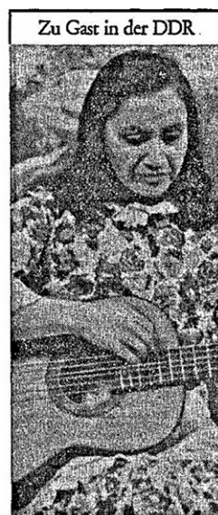
Violeta Parra Sandoval

Figura 5. A la izquierda, fotografía de Isabel y Ángel Parra publicada en Herrmann 1962. A la derecha, fotografía de Violeta Parra en ND 1962.