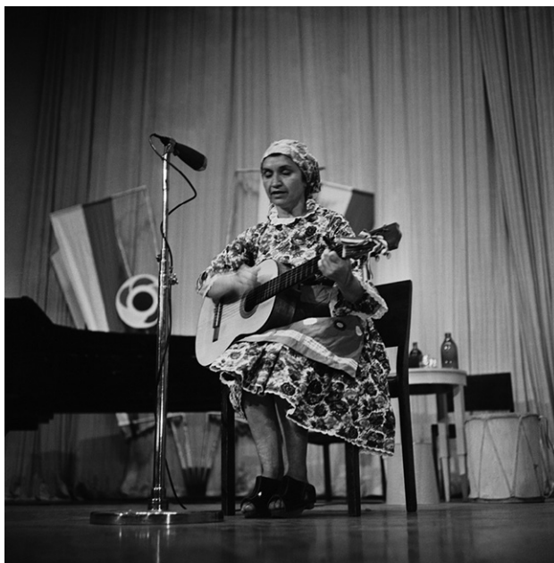
Figura 4. Violeta Parra en el Conservatorio de Helsinki, 1 de agosto, 1962.

Es importante mencionar que todas estas actividades se desarrollaron bajo notorias protestas de la población local. Era la segunda vez que el festival mundial se realizaba fuera del bloque del Este, y el recuerdo vivo de la Guerra de Invierno (que selló la pérdida de territorio finlandés frente a la URSS) movilizó un transversal rechazo hacia la participación soviética de parte de las federaciones estudiantiles locales. Tal como recogía la prensa europea, las protestas fueron intensas durante todo el evento, y mostraron una cara triste del festival: “la policía finlandesa intervino y usó gases lacrimógenos; luego, dada la insistencia de los manifestantes, la política hizo uso de las matracas” (Beuve-Méry 1962). La delegación chilena asistió a estos enfrentamientos en primera persona. Ángel Parra recordaba que no era raro ver “volar tomates” en dirección de las delegaciones internacionales, durante los desfiles realizados por las calles de Helsinki (Herrera 2017: 374).