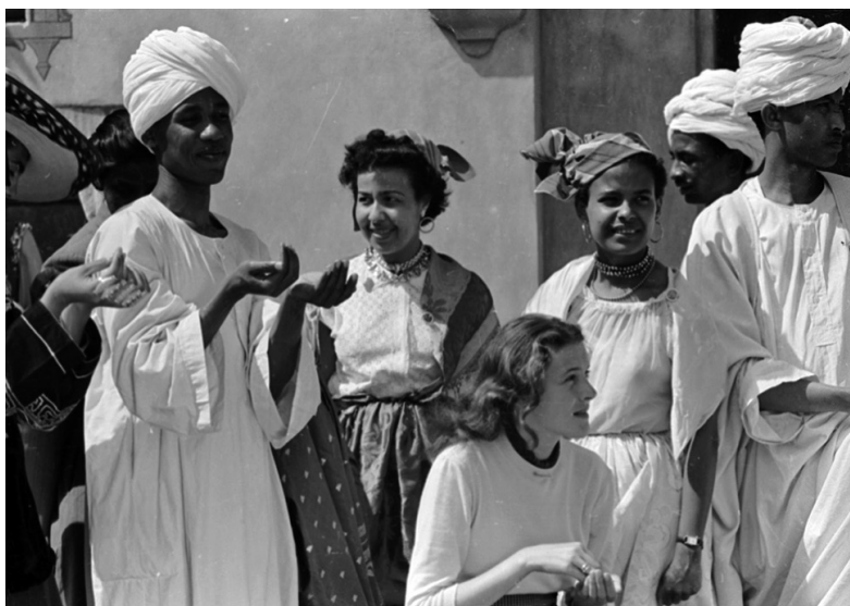
Figura 1. Participantes del 5° Festival Mundial de la Juventud y los Estudiantes.

Nuestro ojo acostumbrado a un cierto tipo de rostro, a una determinada forma de vestir, se encuentra aquí con jóvenes de los cinco continentes, que aportan toda la variedad, toda la riqueza de sus trajes. Pero, ¿a dónde debemos dirigir primero nuestra mirada? ¿Hacia los sombreros de los chilenos , los vestidos de seda de los bailarines chinos, las originales gorras de los estudiantes italianos? ¿A qué? (Namolaru 1956: 8)