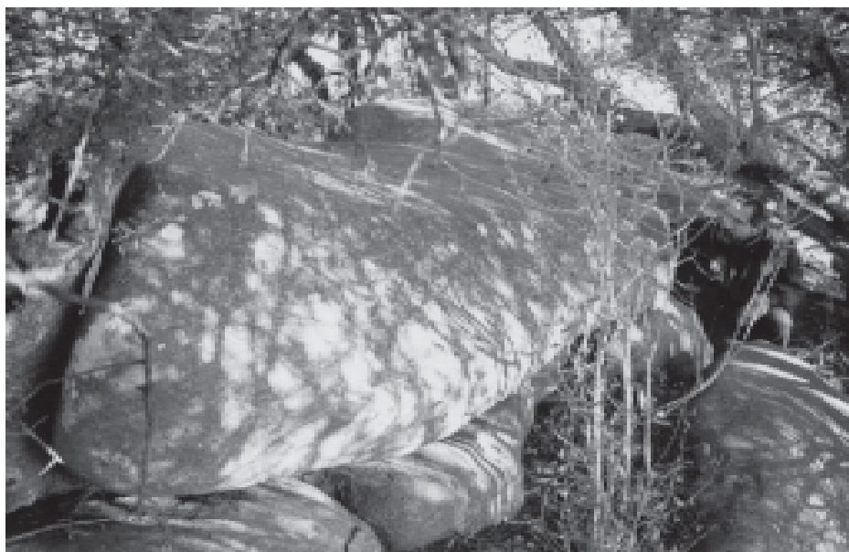
Figura 1. “Piedra campana” del Arroyo de la Virgen: de las dos piedras, ésta es la piedra grande, cuyo peso fue estimado entre cinco y seis toneladas.

Podemos decir que las “piedras campana” son bloques monolíticos de aristas redondeadas. La geología no dispone de una técnica precisa para medir el tamaño de las rocas. Comercialmente se calcula “a ojo” su peso conociendo la densidad del material (que para el microgabro es de 2.9). En este caso, se estimó para la piedra mayor (Figura 1) un peso de entre cinco y seis toneladas y para la menor